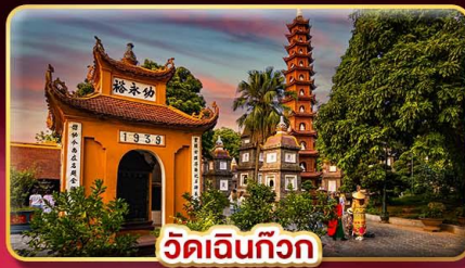
วัดเงินทิว