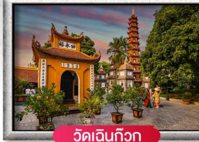
วัดเอนกวิวก