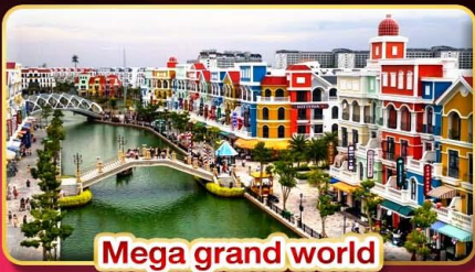
Mega grand world